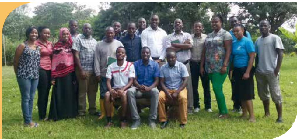
The Sevia team

chakula, mapato zaidi kutokana na kilimo na afya njema.